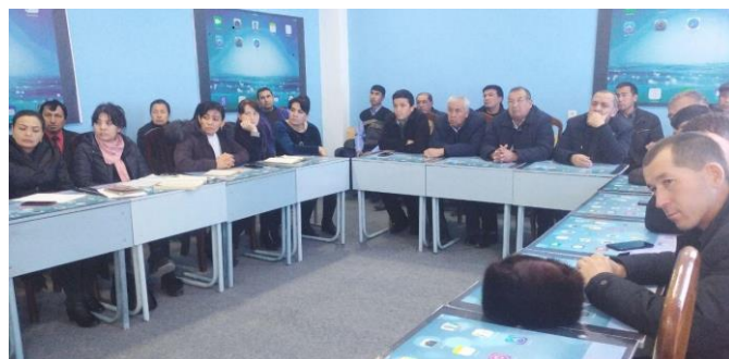
Информационная встреча, г. Карши, Узбекистан, 20.02.2020 Information meeting, Karshi, Uzbekistan, 20.02.2020

с представителями местных властей по развитию сервисных услуг по обслуживанию многоквартирных домов и развитию деятельности управляющих организаций. По итогам встреч представители местных властей выражали готовность поддержке реализации проекта PROMHOUSE и установлению партнёрских отношений с Ассоциацией. Так как потребность в профессиональных специалистах в регионах очень высокая, Ассоциация уже начала предоставлять услуги по повышению квалификации. Первые два вебинара по теме 'Делопроизводство в профессиональных управляющих организациях' были проведены в консорциуме с консалтинговым центром «Kelajak Shahri Rivoji».