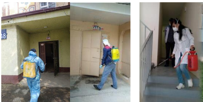
Дезинфекции, проводимые в домах жилищными управляющими компаниями и ТСЖ в Узбекистане, 2020 Disinfections of buildings, conducted by the housing management companies and HOAs in Uzbekistan, 2020

The 10 articles on PROMHOUSE topics written by experts in housing management, project partners and journalists were widely disseminated in the partner countries (see the website https://uyushma.uz/publikacii ). Particular attention was paid to the topics of dual education, development of sector certification, caretaker and of course the topic of coping with the consequences of the coronavirus pandemic.