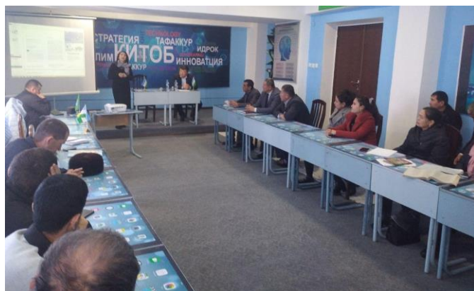
Информационная встреча, г. Карши, Узбекистан, 20.02.2020 Information meeting, Karshi, Uzbekistan, 20.02.2020.

Then, during the work of the 'Curriculum' group, supported by a methodologist, educational programs for technical and vocational education were developed, namely for the qualifications as: «Housing manager» (5th level of the National / Sectoral Qualifications Framework (NQF / SQF) and «Caretaker» (3rd level of the NQF / SQF).