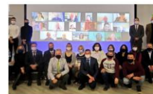
Участники международного семинара МАМН, 9-10 декабря 2020

В течение 2020 года проект успешно кооперировал с другими международными инициативами. Ещё в 2019 году через проект PRO HOUSE, предшествующий проекту PROMHOUSE, были установлены связи между Немецким энергетическим агентством dena и Министерством жилищно-коммунального обслуживания (МЖКО) Узбекистана в области модернизации жилого фонда. Из инициативы совместного Круглого стола (PRO HOUSE, 20.09.2019) выросла идея проекта - энергетической модернизации одного жилого дома, как пилотного объекта, чтобы продемонстрировать на практике большой потенциал экономии энергии при комплексной термомодернизации. Год спустя, 23.10.2020 состоялось совместное мероприятие партнёров проекта PROMHOUSE (из Узбекистана - Ассоциации организаций профессиональных управляющих и обслуживающих жилищный фонд и МЖКО, из Германии - ИВО, dena), где речь шла о профессионализации процесса санации жилого фонда, квалификации собственников жилья. На данный момент для пилотного дома разработаны и обсуждены концепции энергосберегающей санации, выбран оптимальный вариант, проект вступает в стадию планирования. И параллельно планируется следующая встреча, где будет продолжен диалог dena с МЖКО о стратегии развития широкомасштабной энергетической модернизации жилого фонда в Узбекистане.